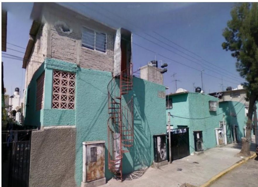
Arenal Puerto-Aéreo (casitas). Google Map