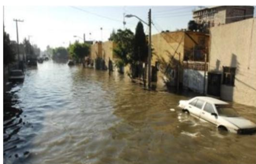
El Arenal Puerto-Aéreo (casitas).