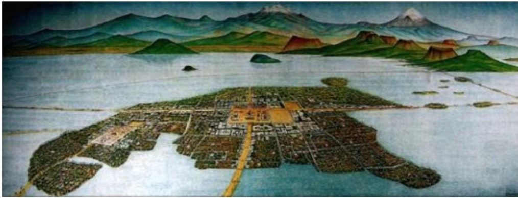
Raíces. La Isla de México en el Siglo XVI. Agustín Uzárraga

pasó de un paisaje semi-natural a un paisaje artificialmente construido que expone a sus residentes a desastres por sismos e inundaciones.