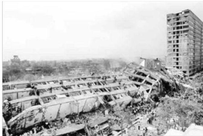
Edificio Nuevo León, Conjunto habitacional Nonoalco-Tlatelolco. Marco Antonio Cruz (en Cuauhtémoc Abarca)

Aunque las imágenes revelan el paisaje triste y desolador que presentaba la Ciudad de México, parcialmente destruida, durante esas primeras horas del 19 de septiembre de 1985, éstas no permiten dimensionar la experiencia que los mismos