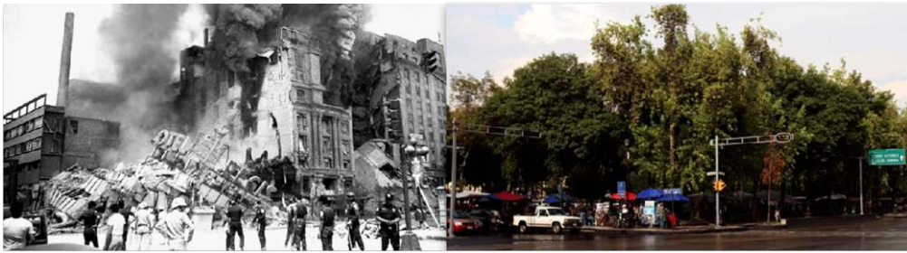
Hotel Regis. Plaza de la Solidaridad

Construido en 1910, el Hotel Regis era un símbolo del lujo del siglo XX. En el terreno se construyó la plaza de la solidaridad, tras su colapso en el sismo de 1985.