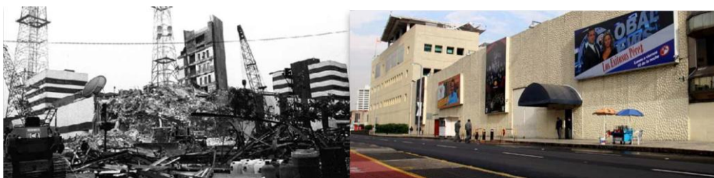
Televisa, Chapultepec. El Universal / Televisa, Chapultepec. Google Map

Televisa Chapultepec se desmoronó durante el sismo al igual que las oficinas de otros medios de comunicación.