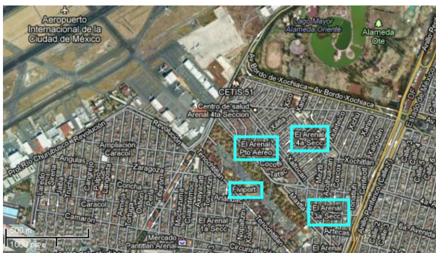
El Arenal.

Por lo que respecta al caso de las inundaciones en El Arenal, aunque éstas no tienen una relación causal directa con los sismos de 1985, la falta de planeación y la reubicación de damnificados en esta zona, cuyas características la hacen susceptible a inundaciones, 54 permiten establecer una responsabilidad de las autoridades al exponer a esta población (una vez afectada por los sismos) a diversos tipos de riesgos. El hecho de haber trasladado a una población que a raíz de los sismos no encontró cabida en aquellos lugares donde habían decidido asentarse, generó lo que Michael Cernea denomina el “abandono de los puntos de referencia simbólica”, toda vez que el rompimiento de los vínculos físico y psicológicos tiene repercusiones en la identidad cultural de la población y, por ende, en el tejido social (Cernea, 1995: 232); lo cual se puede observar en la estructura urbana de la colonia.