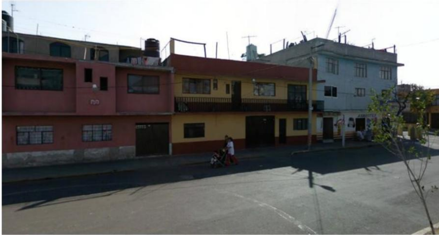
Arenal 4ª sección.