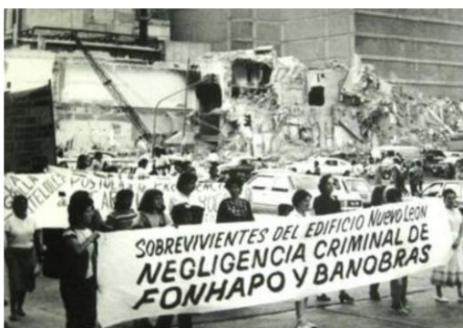
Marcha de los Tlatelolcas. Proceso (en Cuauhtémoc Abarca)

En ese sentido, el desastre permitió externar no sólo las causas y consecuencias aparentes, sino las condiciones en que previamente se encontraban y en la que el desastre los dejó. Es por ello que éstos constituyen procesos que muestran, haciendo referencia a Wilches-Chaux (Wilches-Chaux, 1993: 12) y García (García, 1996a:7), las condiciones en que vive la sociedad y el tipo de relaciones que subyacen a ellas.