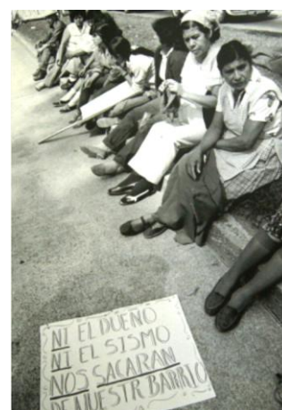
Damnificados. Pedro Valtierra (en Cuauhtémoc Abarca)