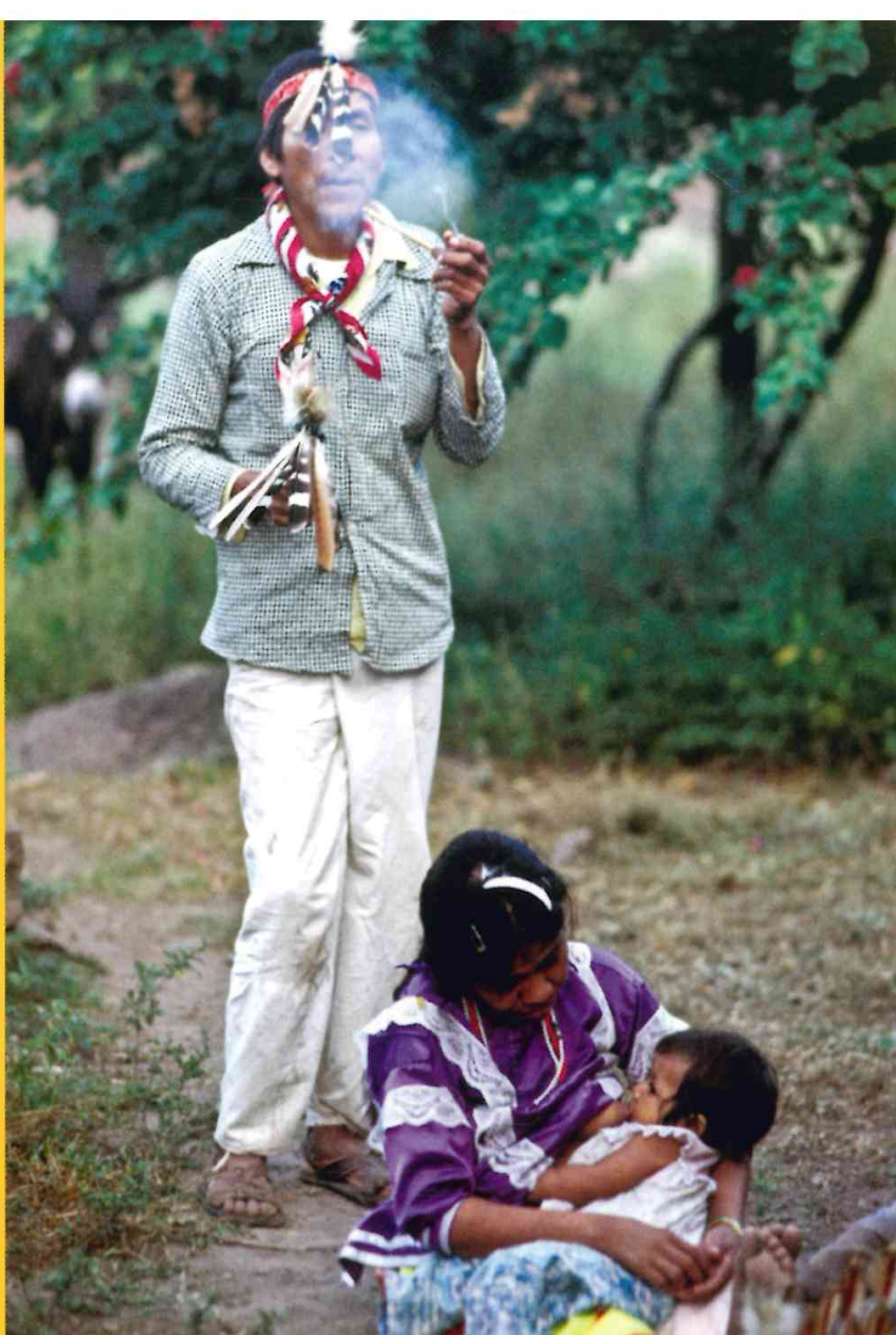
^ Curandero mexicano en una sesión terapéutica del sueño.

El este, lo blanco y el sol son la vida, mientras que el oeste, la obscuridad y lo negro son la enfermedad y la muerte. Pero estos últimos engendran la vida, como sucedió entre los mexicaneros con el sacrificio Tepusilam, a partir del cual nacieron el paisaje como lo conocemos hoy y el movimiento del mundo. ❀