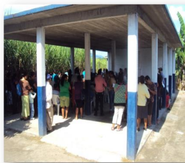
Foto 8. Galera del Centro de salud.