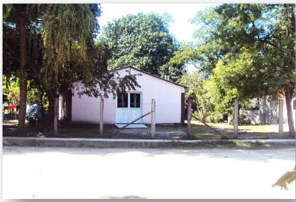
Foto 37. Iglesia evangélica.

En el ejido también existe una iglesia evangélica que por lo regular tiene su reunión de culto los domingos por la tarde. Estas prácticas tienen aproximadamente de 20 a 25 años de antigüedad. Los creyentes se reúnen a escuchar la palabra de Dios, que es