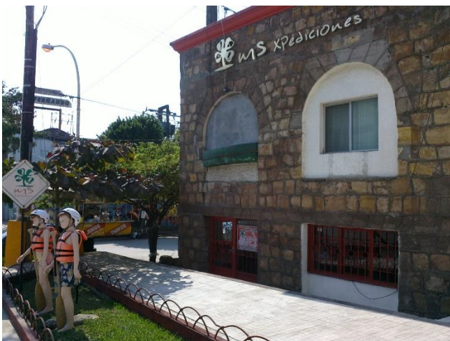
Foto 52. Oficinas de MS Expediciones , a un costado del Hotel La Misión, Cd Valles.