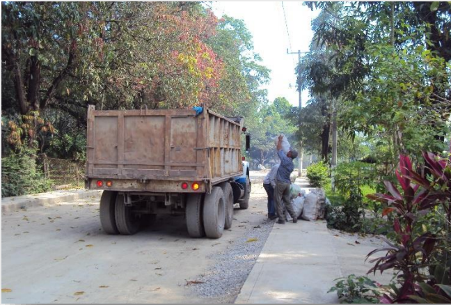
Foto 10. Recolección de basura por parte de las actividades de recolección de basura del Ayuntamiento de Cd. Valles.

Por otro lado, una vez al mes cuentan con la recolección de basura por parte del Ayuntamiento de Ciudad Valles en la localidad, en la que todas las familias participan (Foto 10). Después juntan la papelería con el informe de actividades de