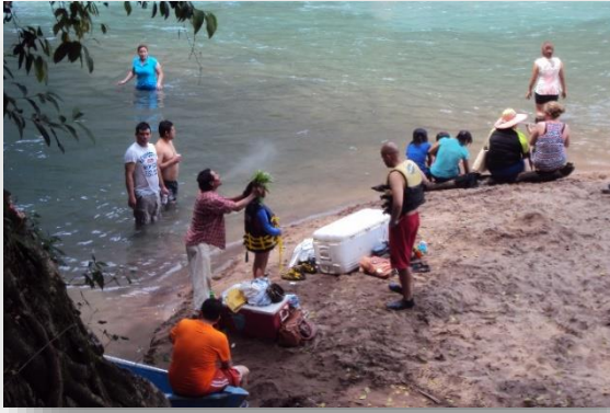
Foto 38. Agua Clara, Semana Santa 2015.

En el ejido, solo hay una mujer de edad adulta que se dedica a dar las limpias y que tiene en su casa un altar a San Judas Tadeo. La persona que acude con ella debe de ir aseada y llevar un manajo de hierba de ahorca judas, un huevo de