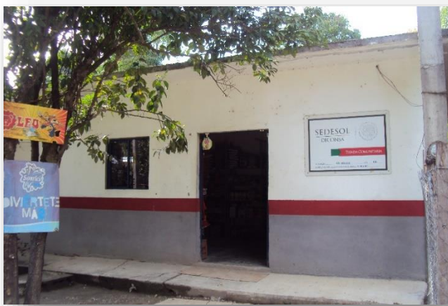
Foto 6. Tienda comunitaria Diconsa.

La comunidad carece de pavimentación y solo disponen de un camino de terracería, al cual le dan revestimiento y mantenimiento con relleno de material llamado “Choy”, cuando es necesario, ya que la rodada de los camiones 17 y las condiciones del suelo (vertisol 17 ) en la región, tienden a ser muy lodosos en temporada de lluvia. El material es proporcionado por los ingenios que se abastecen de la caña cultivada localmente en temporada de la zafra. Con este revestimiento de material se evita el atascamiento de los camiones que cargan la caña con destino a los ingenios de la región. El Sidral se distingue por ser un centro rururbano por disponer de infraestructura de alumbrado público, una red de cobertura de telefonía celular, luz eléctrica en las viviendas y agua entubada. La mayoría de las viviendas tiene letrinas, ante la falta de red de drenaje para residuos sanitarios. También cuentan con una galera techada para realizar actividades y dos tiendas de abarrotes para consumo local (Foto 6).