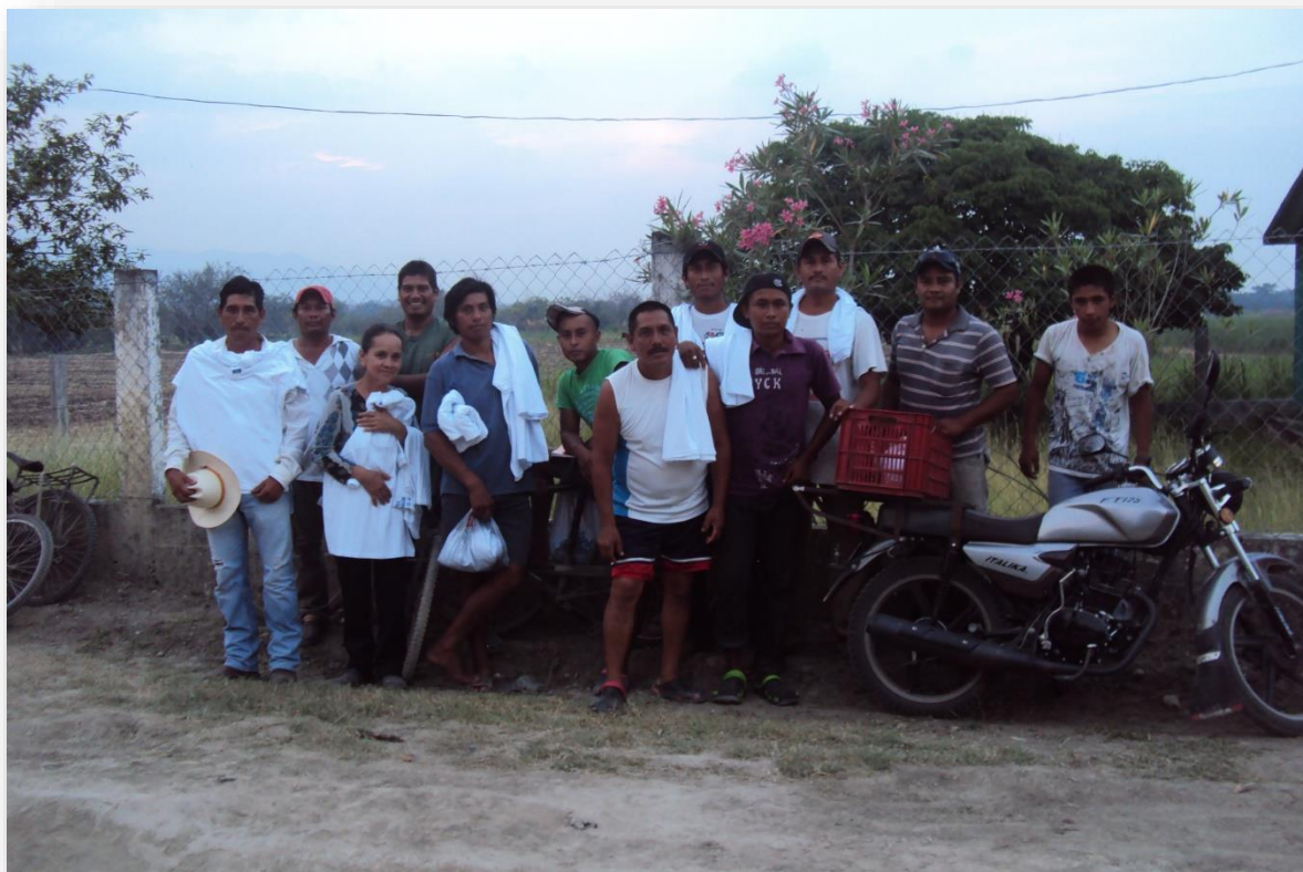
Foto 42. Reunión para entrega de playeras a los lancheros del Sidral, mayo 2015.

En mis primeros acercamientos al grupo de lancheros, en primera instancia conocí a su representante, quien me dio el primer paseo en su lancha. Conforme fui familiarizándome con la comunidad y específicamente el grupo de lancheros, descubrí que el oficio de lanchero no es una actividad fácil que podría desempeñar cualquier poblador de El Sidral. Para conducir la lancha hay que tener destreza, no solo fuerza para navegar y atracar, sino conocimiento obtenido a través de la experiencia y del entrenamiento de los sentidos para poder identificar las corrientes y evitar los accidentes. Al escuchar las conversaciones que