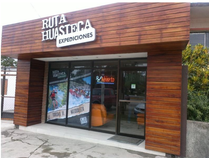
Foto 53. Oficina de Ruta Huasteca Cd. Valles.