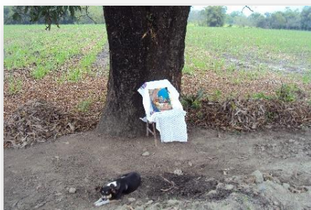
Foto 31 y 32. Estaciones para el viacrucis de Semana Santa, en el 2015.

Con el inicio de la Semana Santa en el calendario, algunos habitantes aún conservan las tradiciones de cumplir con las actividades de la cuaresma en la capilla. Su capilla pertenece a la adscripción del Ejido La Lima en el corredor de la zona teenek, donde se concentran los servicios de la iglesia. En la capilla sólo les ofician misas una vez al mes. En el caso de la cuaresma de 2015, el grupo de señoras de la capilla organizó un viacrucis. Se repartieron las 14 estaciones a lo largo del camino que cruza el ejido, iniciando en el puente y terminando en la curva donde terminan las viviendas. En cada estación pusieron una imagen representativa y pusieron manzanilla, flores y una vela (Foto 31 y 32). En el viacrucis, hubo hombres voluntarios que se turnaban para llevar una cruz de madera, mientras la gente acompañaba con rezos. En esta actividad participan hombres, mujeres, adolescentes y niños. El sábado de gloria por la tarde se organizaron para hacer la bendición del fuego y una misa para conmemorar la resurrección, ya que el domingo el padre asiste a la misa de resurrección en el ejido de La Lima.