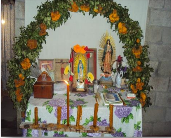
Foto 33. Altar de muertos, noviembre 2014.

Una de las fiestas de mayor tradición en la Huasteca Potosina es el día de “Todos los santos”. En el ejido El Sidral, el 2 de noviembre levantan el altar en honor a sus seres queridos ya fallecidos. Adornan con ramas de limolina en el arco, flores de cempasúchil, velas, dulces de calaverita, aguardiente y comida que le