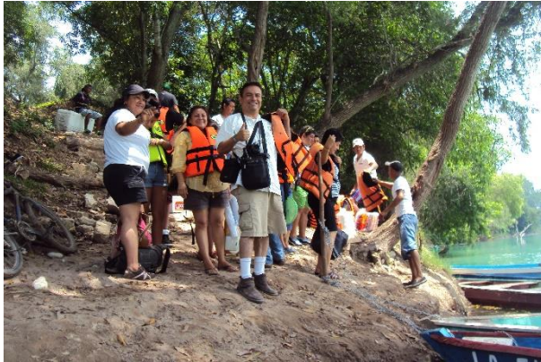
Foto 44. Con representantes de medio de comunicación de Ciudad Valles, abril 2015.