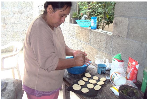
Foto 21. Preparación de pan y acomodo en las charolas.