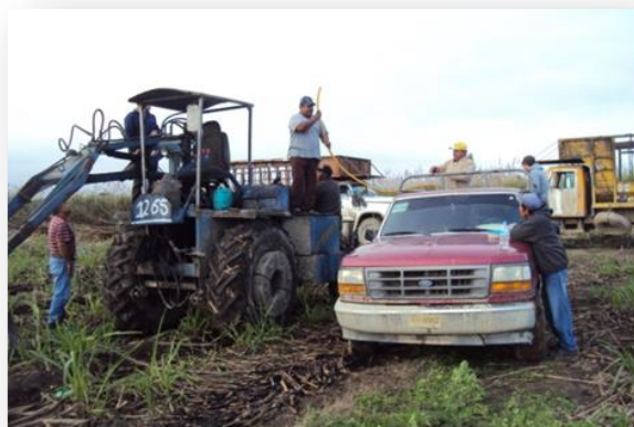
Foto 25 y 26. Jornada del corte de caña, con el equipo de cortadores del Sidral, enero 2015.

temporada de zafra, que inicia en noviembre y termina en mayo o junio. Un cabo maneja la zona del El Sidral y otro la de El Detalle (Foto 24). La mayoría de los cortadores pertenecen al ejido, mientras que algunos son de otras localidades cercanas. Al inicio del corte, se les da de alta en el seguro y se les paga quincenalmente, además de que reciben una despensa como incentivo al cortador. El seguro solo se les da si se mantienen constantes en toda la jornada del corte de la caña. Si deciden trabajar de manera intermitente, también se les contrata, ofreciéndoles solo el pago por los días que cortan en el campo.