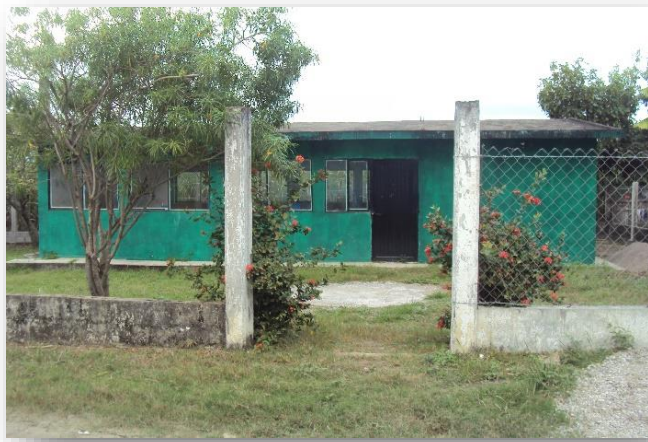
foto 14. Salón Ejidal, El Sidral.

cambios reflejan una adaptación ante la situación provocada por la migración frecuente de los hombres.