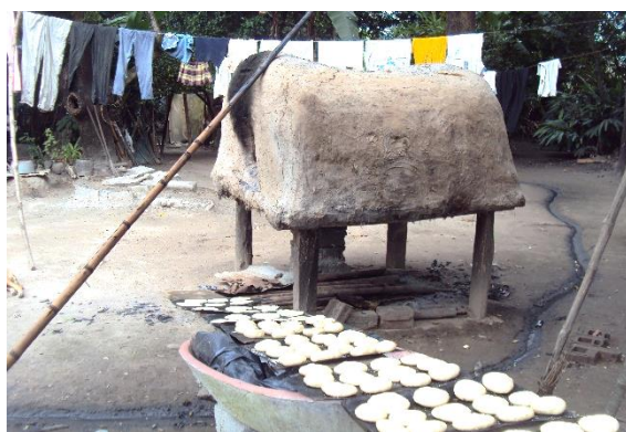
Foto 22. Horno de otate, revestido de lodo y zacate para hornear pan.

Para la preparación de pan casero se compran 1 kg de harina de trigo, 1 kg de manteca vegetal. Se revuelve la harina, la manteca derretida, media cucharada sopera de sal, \frac{1}{2} taza de azúcar, 1 huevo, agua y una cucharada de levadura; se mezclan todos los ingredientes hasta tener una pasta uniforme y se deja reposar unos 30 minutos para que esponje la masa. Después se amasan con las palmas de las manos bolitas pequeñas de masa, que se les va dando forma con el rodillo apoyándose en la mesa, donde se le espolvorea harina suelta para que no se pegue la masa. Para el relleno de las empanadas, revuelven queso molido, azúcar y canela molida (también le pueden poner mermelada), después se dobla la tortilla y se va sellando con los dedos y le espolvorean azúcar por encima. Conforme se van teniendo lista las empanadas, se les pone manteca en las charolas y se van acomodando las piezas. Mientras van preparando el horno y se va atizando la leña, desde unos 45 minutos antes, para que se caliente. Una vez ya calentado se van metiendo las charolas al horno con una pala de madera para evitar quemarse. Una vez que el pan va tomando color, se van sacando las charolas y