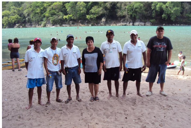
Foto 48. Los lancharos con la representante de turismo municipal.