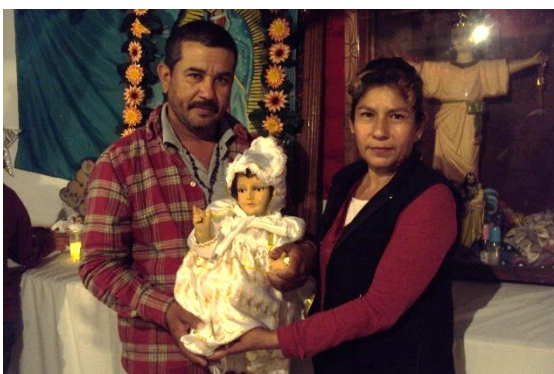
Foto 30. Levantada del niño Dios en la capilla de Guadalupe. enero 2015.

Para la entrada del año nuevo, la noche del 6 de enero, inician con la tradicional levantada del niño Dios dentro de la capilla. La misa es acompañada por el coro de niños de la localidad y por personas que tocan la guitarra. Al final de la misa una pareja o matrimonio, que han sido designados como padrinos del niño Dios, regalan un vestido nuevo y dan dulces como “símbolo de reliquia”, cuando se acercan los creyentes a adorar al niño Dios (Foto 30). Conforme van pasando los días del mes de enero, las familias van preparando diversas “levantadas” en sus casas e invitan a familiares, amigos y vecinos cercanos. Para acompañar la celebración, se invita a una rezadora que ofrece un rosario por el niño Dios y se le otorga un apoyo monetario voluntario. Esta rezadora es de la localidad y pertenece a una de las familias del ejido; ella presta sus servicios para apoyar a los habitantes y conserva el gusto por la participación en las actividades religiosas. Cada familia compra o hace un vestido nuevo para el niño Dios que mantienen en casa y se lo colocan después del rosario. Una vez vestido, lo sientan en una silla pequeña de madera y ofrecen un pequeño convivio a los asistentes, entregando a cada persona tamales y atole de naranja, piña o café.