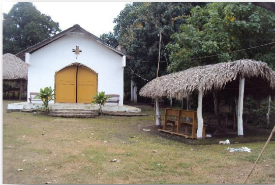
Foto 29. Capilla dedicada a la Virgen de Guadalupe.