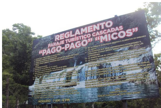
Foto 50. Reglamento básico en paraje Pago Pago Micos.