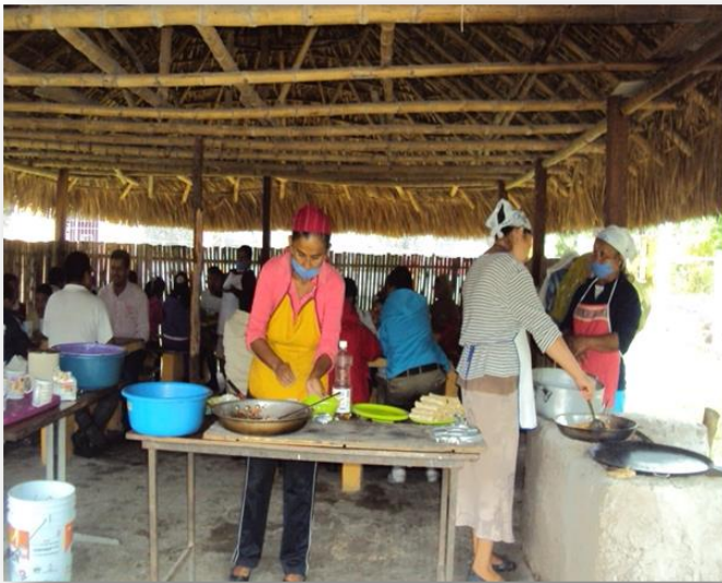
Foto 19. Grupo de madres de familia que participan en la preparación de la comida en la escuela primaria rural "Emiliano Zapata".

Las mujeres también comen en la mesa con sus familias, al final se encargan de lavar los trastes usados y dar el desperdicio a los animales de casa. En las ocasiones que tienen invitados les ofrecen primero de comer, pero también se sientan a la par a comer juntos como parte de la atención y convivencia. Los guisos especiales para esas ocasiones consisten en mole con pollo, arroz, chochas, palmito, nopales o salpicón de pescado fresco. En las reuniones familiares preparan tamales, carne de puerco con salsa, bolim o zacahuil. En la elaboración de la comida del diario siempre hay café de olla, huevo con frijoles, gorditas, entomatadas con queso, requesón, atole o avena, leche, sopa aguada, pan comercial o canela con leche 51 .