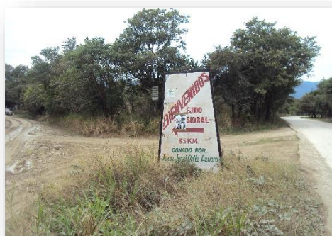
Foto 3. Letrero de desviación al ejido El Sidral (a la izquierda se ubica la entrada al panteón local).

cuyos hijos desean y que tienen las posibilidades de continuar con sus estudios, los envían al COBACH-EMSAD 21 (Educación Media Superior a distancia) 16 , ubicado en el ejido La Pila. Para las reuniones de importancia con los habitantes, cuentan con un salón ejidal para los acuerdos de Asamblea en donde se tratan asuntos administrativos, mejoras y asuntos relevantes de la comunidad. Para la cabecera y sus anexos, tienen un cementerio comunitario ubicado a 2.8 km de distancia de El Sidral (Foto 3).