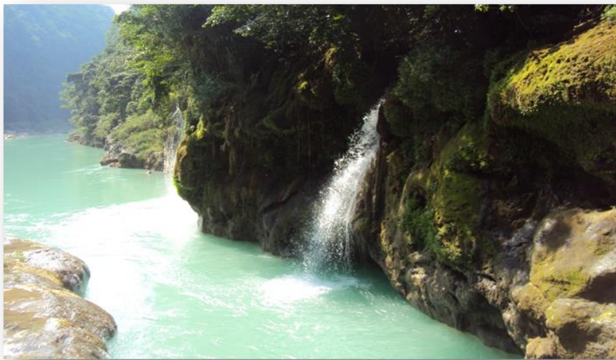
Foto 2. Puente de Dios, río Tapaón.