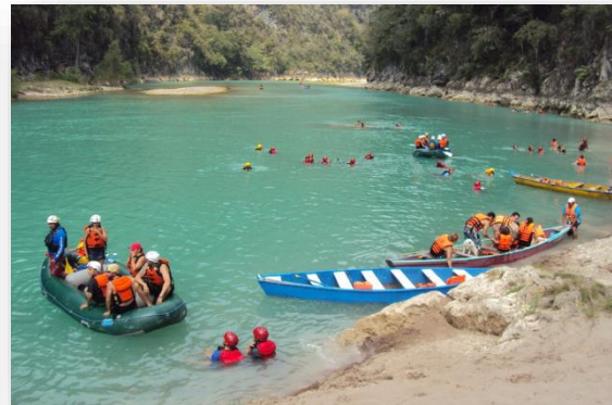
Foto 28. Puente de Dios, Río Tampaón.

Sobre el tema central de esta tesis, el turismo, en este apartado simplemente haré una aproximación a esta actividad, como parte del conjunto de actividades que realizan en El Sidral, sin un propósito analítico. Incluso las imágenes arriba mostradas pueden provocar un extrañamiento de una comunidad que he venido describiendo idealmente en sus faenas y quehaceres cotidianos. Ya abriré el espacio para profundizar en el Capítulo 3.