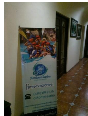
Fotos 55 y 56. Oficinas de Aventura Huasteca dentro del Hotel Valles.