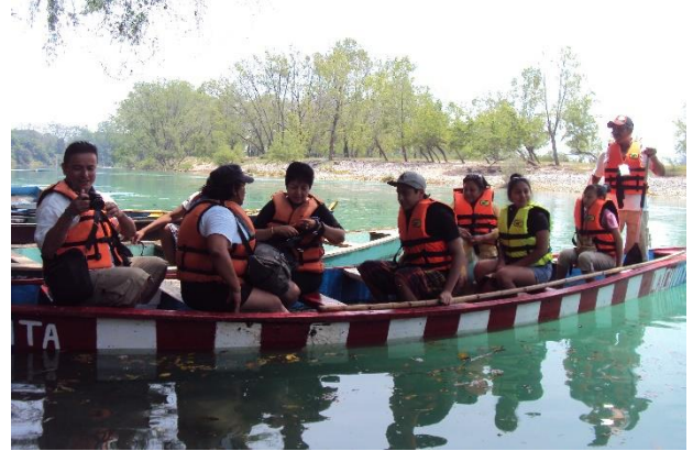
Foto 45. Representantes de medio de comunicación realizan un recorrido por el río Tapaón.