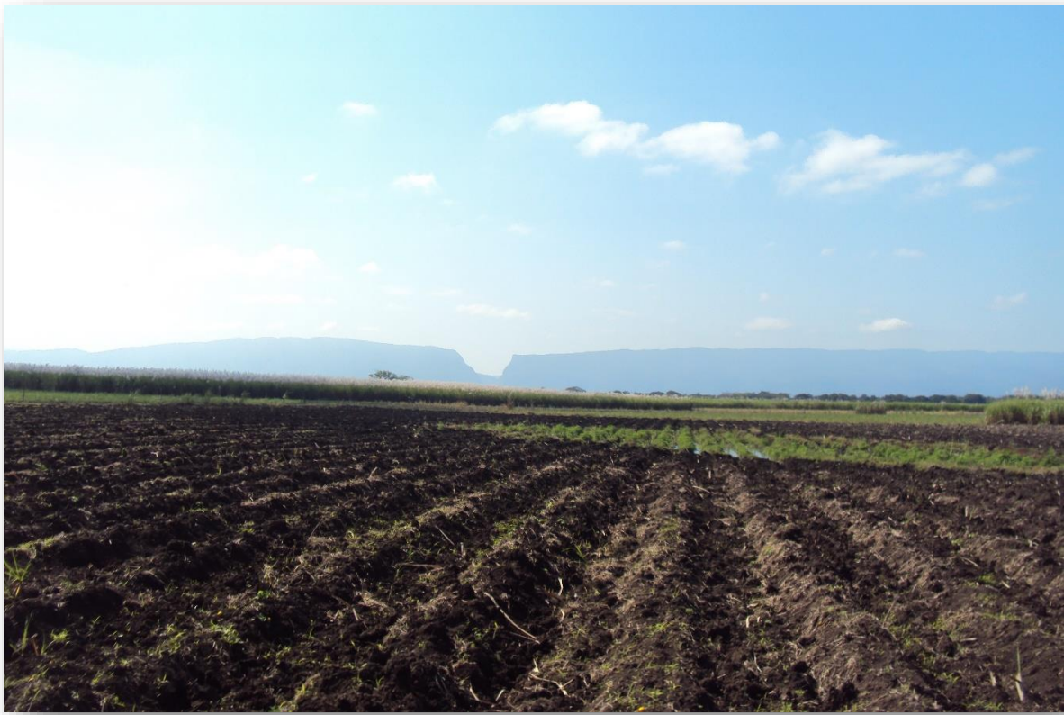
Foto 39. Campo de caña, zona de San Miguel, enero 2015.