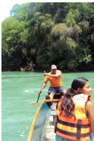
Foto 51. Paseo en lancha paraje Micos.

El Ejido del Platanito se ubica al noroeste en el municipio de Cd. Valles, colinda al norte con el río Micos, al Oeste con el ejido Estación Micos, al sur con el Ejido Coyoles (Foto 49, 50 y 51). En el ejido hay un paraje turístico, “Pago pago Micos”, donde existe una cooperativa organizada, que desarrolla el turismo desde hace casi 30 años. A finales de junio, en el ejido El Platanito inicié mis primeros acercamientos con la organización de la cooperativa y el grupo de lancheros. Ello coincidió con la temporada de verano, cuando el río estuvo crecido, por lo que se suspendieron las actividades turísticas en el paraje. En las entrevistas se hizo la