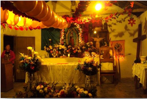
Foto 34. Misa de celebración a la Virgen de Guadalupe, El Sidral, diciembre de 2014.

En la fiesta de la virgen de Guadalupe, días antes se pinta la capilla y el día 12, desde muy temprano, se inicia el festejo con cuetes. El interior y el marco de la entrada de la capilla se adornan con globos y cadenas de papel de china de colores; al final de la celebración de