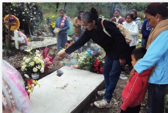
Foto 36. Colocación de la cruz en compañía de los padrinos en el panteón de la comunidad.

tamales y café en agradecimiento por haberlos acompañado en el rezo. También en agradecimiento, la familia del difunto le da alguna cooperación voluntaria a la rezadora y comida (Foto 36).