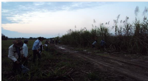
Foto 40. Cortadores de caña preparando sus machetes.

Una vez que los camiones cargados de caña llegan al ingenio, se descargan los camiones y se calcula el jugo de la caña. Es ahí cuando los jefes de las agrupaciones cañeras terminan su labor de supervisión de la cosecha e inicia el proceso industrial en el ingenio.