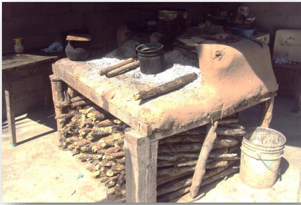
Foto 13. Hornilla de cocina.

En la comunidad suele haber varias casas construidas dentro de pequeñas propiedades, denominadas solares, donde regularmente los hijos construyen sus viviendas. La residencia que se ha mantenido en la localidad es patrilocal 31 y las formas en que se da la herencia es patrilineal. Además, la distribución de solares sigue una regla apegada al parentesco extenso por vía paterna 32 , según se dio la primera dotación de tierras a la localidad, sus miembros fueron escogiendo solares conjuntos a partir de la filiación y con el tiempo, además del aumento de la descendencia, fueron construyéndose más viviendas próximas donde se concentran grupos de parentesco.