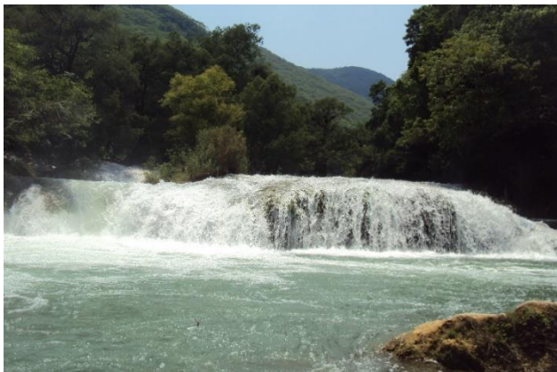
Foto 49. Cascada de Micos.