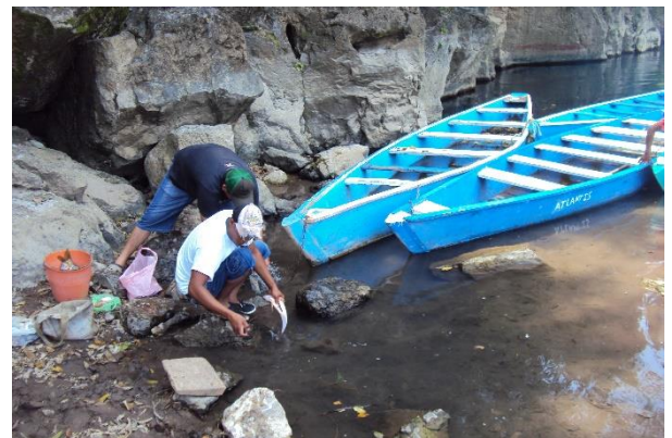
Foto 47. Los lancharos alían el pescado para ofrecer una comida a los representantes de medio de comunicación, abril 2015.