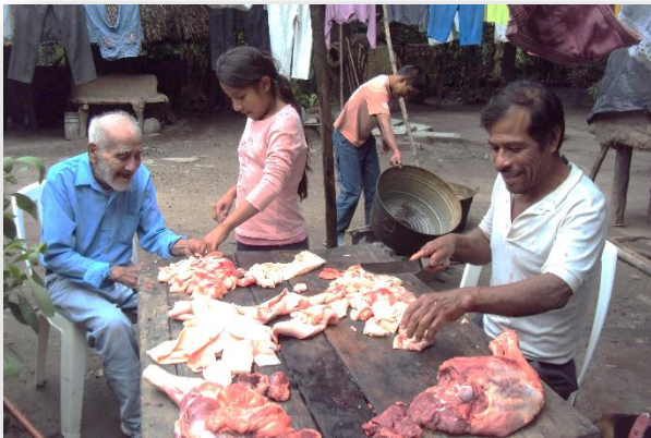
Foto 20. Limpieza y preparación de la carne de puerco para consumo del hogar.

En la comida la madre de familia se da a la tarea de la preparación de los alimentos y si tiene hijas, ellas también participan en la elaboración. Ella se encarga de servir la comida y tener masa preparada para la elaboración de las tortillas hechas a mano. Cuando hay reuniones familiares, se da a la tarea de preparar tamales de carne de puerco o de pollo, mole rojo con pollo y arroz, pescado frito a las brasas o caldo de pescado. Si tienen la oportunidad de comprar un puerco de engorda lo alojan en un corral cercado en una parte alejada de la vivienda en el solar y le dan desperdicios orgánicos.