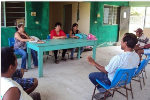
Foto 43. Reunión con representantes de turismo municipal en el salón ejidal, abril 2015.

era que para el sábado 18 de abril se tenía contemplada una visita de medios de radio y televisión, para hacerle difusión al lugar y prepararse para los puentes de mayo y la temporada de verano, con la intención de que los conocieran y los consideraran como un destino alternativo para visitar en la Huasteca Potosina (Foto 43).