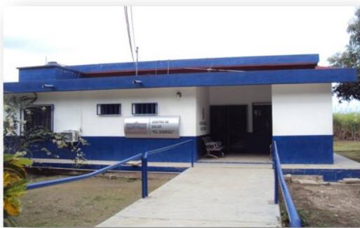
Foto 7. Centro de salud, El Sidral.