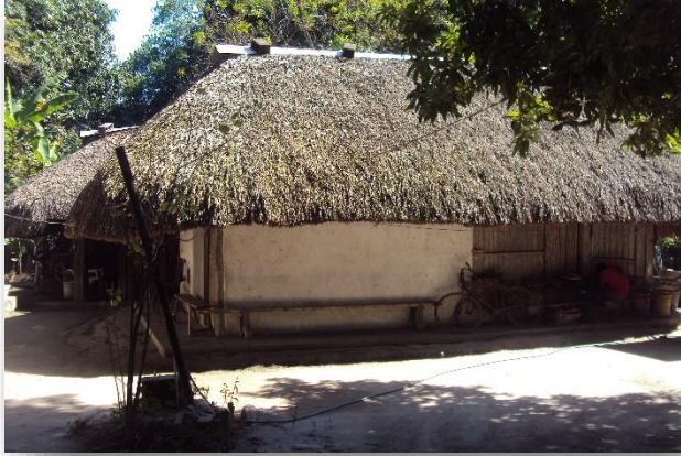
Foto 11. Vivienda tradicional.

cubierto de palmas, que se van amarrando para fijarlas a dos aguas, para que escurra el agua en la temporada de lluvia.