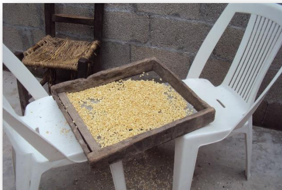
Foto 18. Limpieza de semilla de maíz para el nixtamal.

por la mañana. Durante el periodo de cosecha, toda la familia suele participar en las actividades, tanto del secado de las mazorcas, el desgranado y la limpieza (Foto 18).