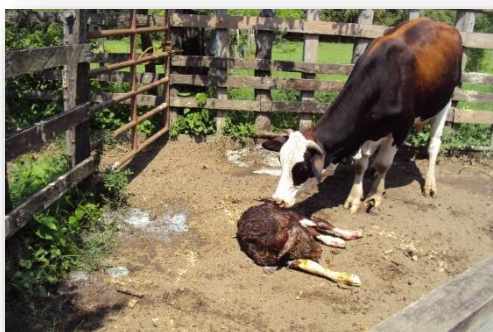
Foto 23. Alumbramiento de cría de ganado vacuno.

lo pueden llegar a vender a $50.00 pesos el kg, con lo que logran obtener ingresos de hasta $400.00 pesos 59 . Algunas de las familias ofrecen a los turistas lo que pescan, pero los que hacen la venta son también vecinos de otras localidades de San Carlos, que se dedican a pescar cada tercer día y lo comercializan en el mercado de Ciudad Valles 60 .