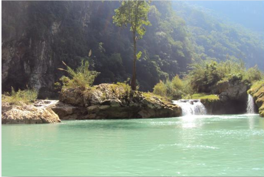
Foto 1. Puente de Dios, río Tapaón.