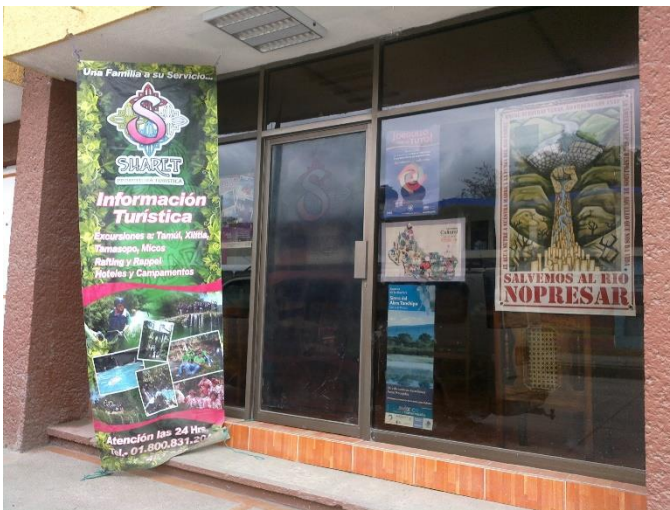
Foto 54. Oficinas de Sharet, otra operadora turística, a un lado del Hotel Quinta Mar, Cd. Valles.