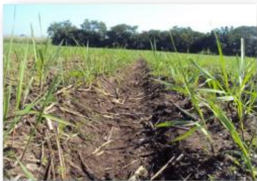
Foto 24. Sembradío de caña, Ejido El Cuiche.

En la localidad hay diversos trabajos asalariados a los cuales los habitantes tienen acceso como: encargado de la tienda de DICONSA, cuidador de milpas, mantenimiento de casas, cortador de la caña o albañil. Pero los principales trabajos asalariados están fuera de la localidad, lo que