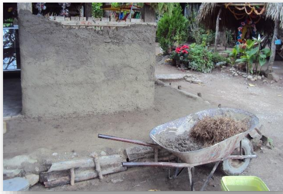
Foto 12. preparación de material para el enjarrado de la vivienda.

La vivienda cuenta con las siguientes características, con pisos de cemento, ninguna tiene drenaje, pero si cuentan con agua entubada no potable. Las viviendas del ejido son construidas con estructuras de otates 29 , algunas tienen sus paredes revestidas de lodo y zacate o pintadas con cal blanca, lo cual hace una consistencia más resistente, a este acabado le llaman “enjarrado” (Foto 11).