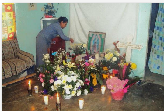
Foto 35. Celebración del rosario del difunto, para levantar la cruz y colocarla en el panteón de la comunidad.

blanca de material, que regalan los padrinos, ya con el nombre grabado. En la casa le ponen un altar, le ponen a su alrededor flores y la limpian con copal bendito. La rezadora de la comunidad, prende las velas y le hace un rosario en ofrecimiento de su eterno descanso (Foto 35). Al terminar el rezo, la familia, amigos y vecinos los acompañan, pero los únicos que tocan la cruz son los padrinos, que la suben a una camioneta para llevarla al panteón local. Le cargan todas las flores que la gente le trajo y en el camino se mantiene el copal prendido.