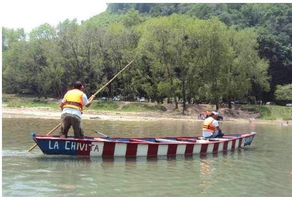
Foto 46. Un recorrido apacible.