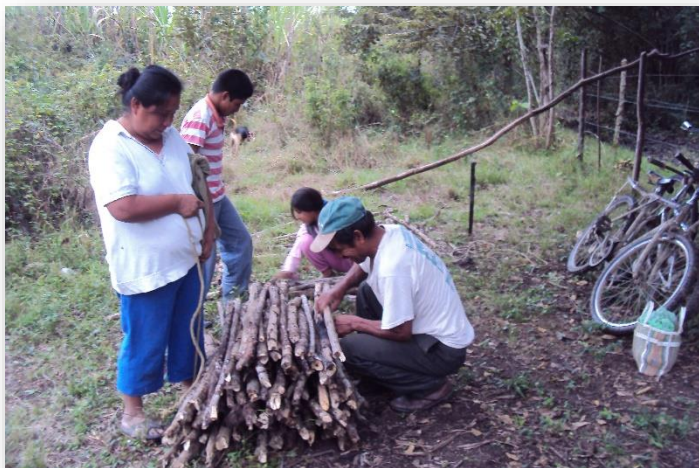
Foto 16. recolección de la leña para el consumo del hogar.

En la localidad se utilizan como combustibles la madera de árboles, gasolina y gas L.P. La leña y el gas L.P. se utilizan para la preparación de alimentos ya que las viviendas suelen tener estufas de gas y hornillas de leña, y la gasolina se usa como comburente y para los automóviles o motocicleta. Para la recolección de leña, las familias recolectan madera de los árboles en las sierras aledañas o en las cercanías de sus parcelas.