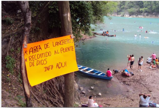
Foto 27. Río Tampaón. Zona de embarque para traslado de turistas al Puente de Dios.