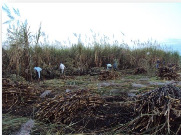
Foto 41. Cortadores ubicándose en sus gabillas.

El cabo del equipo del Sidral nos comparte su experiencia y vivencias en el corte de la caña: