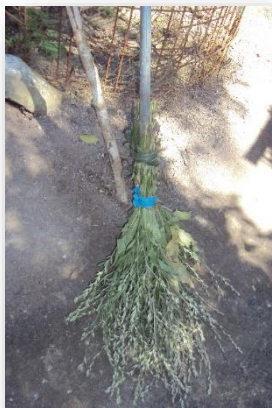
Foto 17. Escoba con material de especies arbustivas.

Cuando las familias van a la recolección de leña, principalmente las mujeres encargadas de las labores domésticas, aprovechan el desplazamiento para recolectar especies arbustivas, conocidas en la comunidad como chaile, malva y manzanilla, para hacer escobas. Una vez recolectadas las suficientes ramas se unen y amarran a un palo, precisamente confeccionado, con cintas de tela, mecate, palma o alambre (Foto 17).