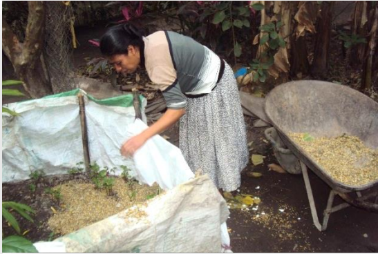
Foto 9. Huerto en casa como parte de las actividades de los programas sociales.

En la temporada de 2014-2015, la clínica de salud hizo una campaña de limpieza de caries dental con la misión de certificar a la comunidad; en ella se comprometieron a atender a sus habitantes y a comunidades aledañas que pertenecen al sector. En esta organización, las personas eran apoyadas por las promotoras voluntarias, para fomentar la comunicación y recordar la asistencia puntual del paciente a la clínica, y los dentistas y médicos llevaban un control de citas.