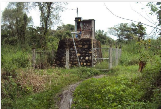
Foto 15. Bomba para la distribución de agua en el ejido.

mil litros y se utiliza una bomba de gasolina que genera la presión necesaria para que llegue a todos los hogares; para encender la bomba de agua se designa a una persona para que lo haga dos veces al día, la primera entre las ocho y nueve de la mañana, y la segunda entre las cinco y las seis de la tarde 45 .