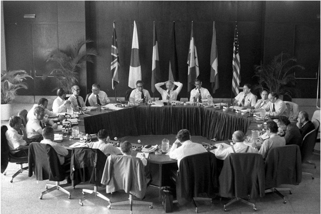
Imagen 3: Primera reunión del G7

desarrollo económico, así como en los sistemas políticos y sociales y garantizar condiciones equilibradas para un desarrollo constante.