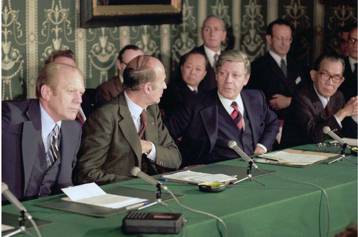
Imagen 2: Primera reunión del G6