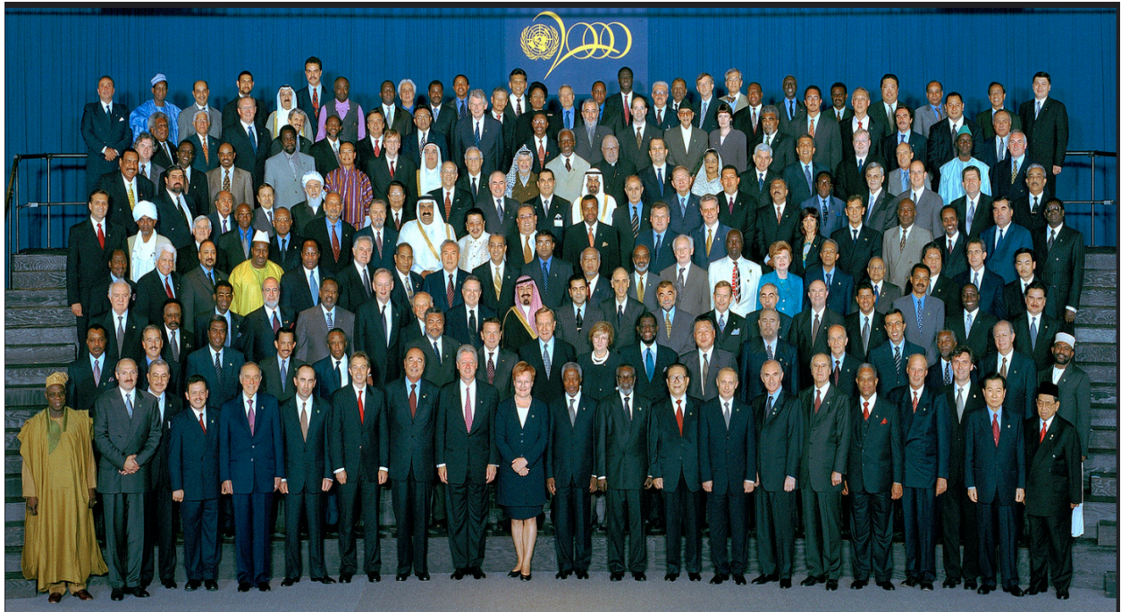
Imagen 1: Cumbre del Milenio

por medio de estrategias para construir un mundo desarrollado. En la siguiente imagen se puede apreciar a los participantes, antes mencionados, de esta Cumbre.