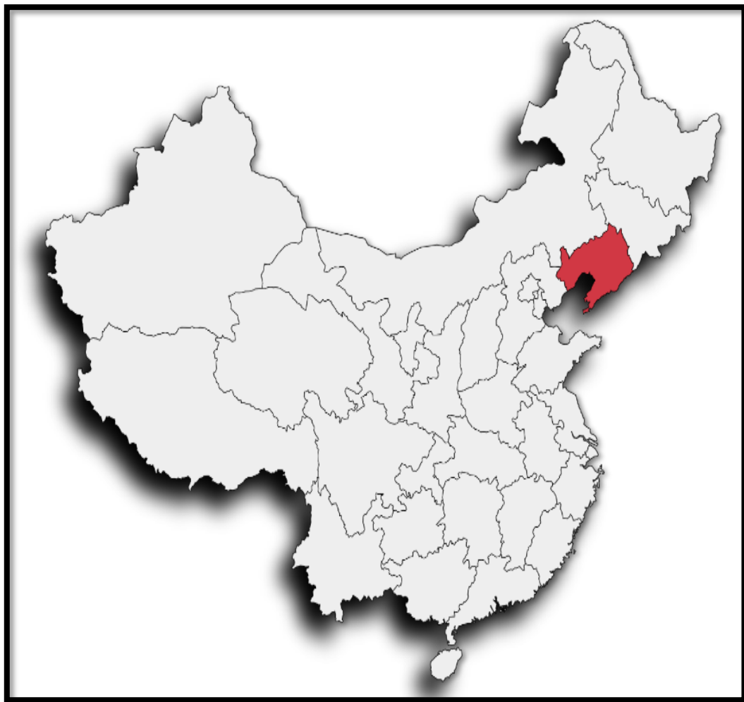
Mapa 2. Provincia de Liaoning