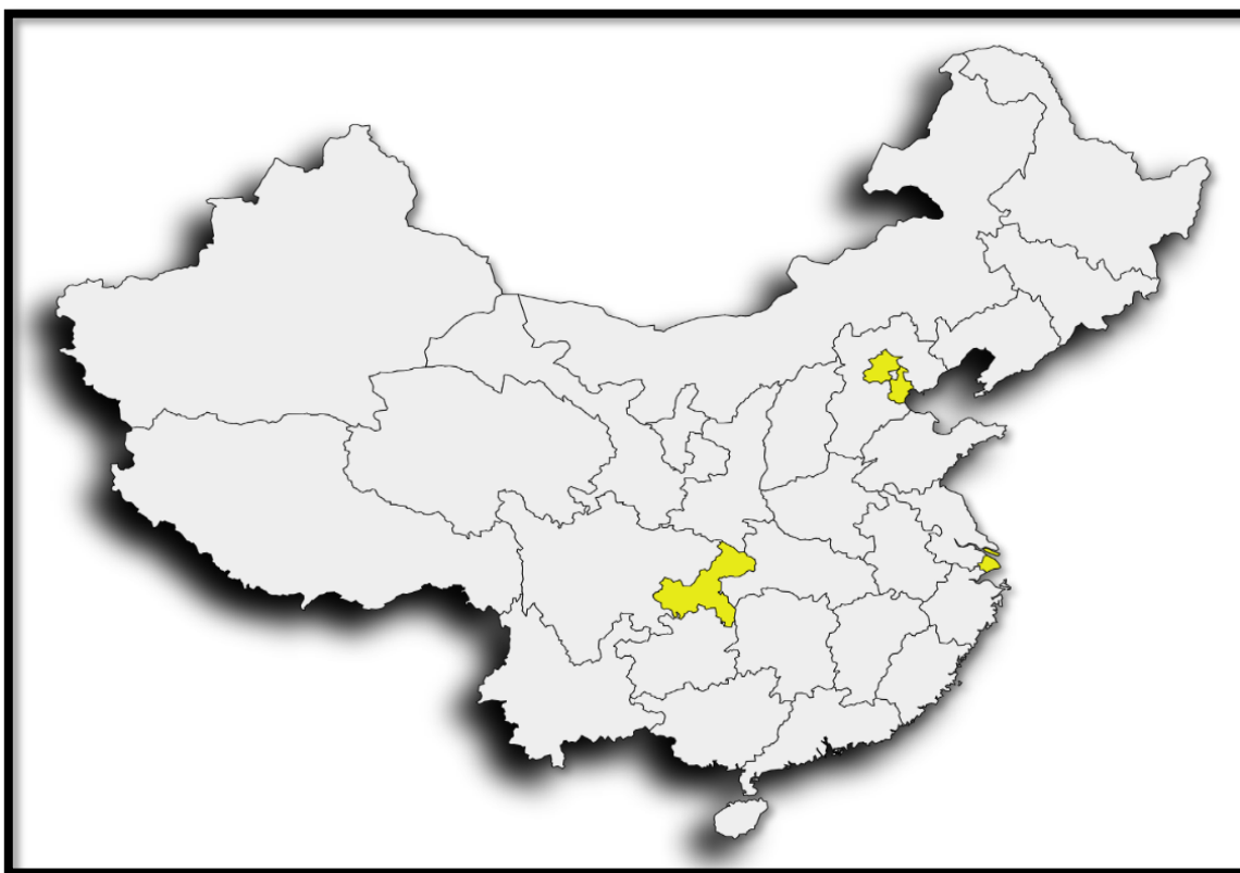
Mapa 4. Las cuatro Municipalidades de la República Popular China