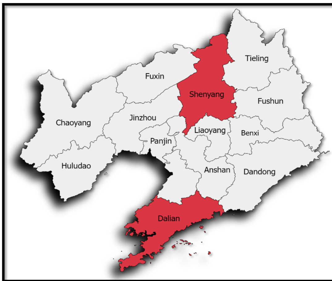
Mapa 3. División Administrativa de la Provincia de Liaoning