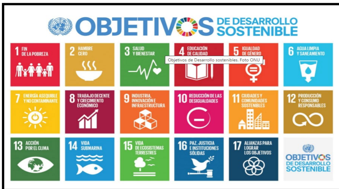
Cuadro 4.- Los Objetivos de Desarrollo Sostenible