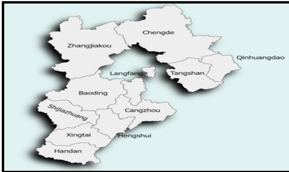
Mapa n° 1. Las Ciudades de la Provincia de Hebei

Fuente: elaboración propia a través de la herramienta online: Paintmaps.com